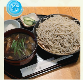
◇そば処 いい友 ●茄子と舞たけの冷やしつけそば 1,200円 (15食) 常陸太田市 高貫町 1446-4 定休/月~木曜