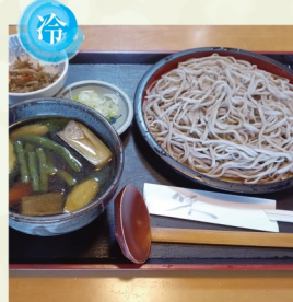
◇いっぷく亭 ●夏つけけんちゃん 1,250円 (10食) 常陸太田市新宿町 1430-14 Tel.0294-72-8803 定休/月曜