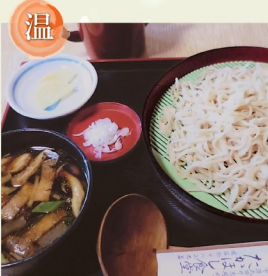
◇たかほし食堂 ●夏けんちゃんつけそば 950円 常陸太田市馬場町 527-1 Tel.0294-72-0839 定休/第3火曜