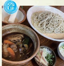
◇手打ちそば処 金砂そば ●夏けんちゃん 1,350円 (10食) 常陸太田市久米町 120-1 Tel.0294-76-0789 定休/火・金曜