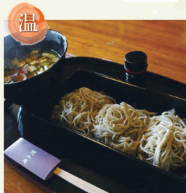
◇古式健珍蕎麦 慈久庵 ●古式けんちゃん蕎麦 1,900円 (20食) 常陸太田市天下野町 2162 Tel.0294-70-6290 (予約不可) 定休/火・水・木曜