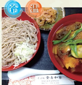
◇登喜和家 ●夏けんちゃんそば 1,200円 常陸太田市高柿町 343 Tel.0294-76-2330 定休/日・月曜 (月曜が祝日の場合は翌営業日)