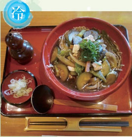
◇SOVA TEA 越路 ●夏けんちゃん 1,300円 (20食) 常陸太田市稲木町 1395-4 Tel.0294-72-2333 定休/月・第4火水曜

常陸太田の名物「夏けんちゃん」に加え、 各店自慢の「夏特別メニュー」をお楽しみください。