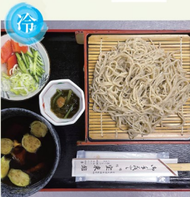
◇宝来館 ●夏けんちゃん 1,200円 (20食) 常陸太田市棚谷町 1950 Tel.0294-85-0114 定休/5の付く日 (土日の場合は翌営業日) (祝日の場合は翌営業日)