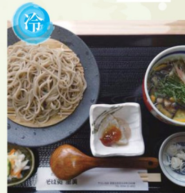
◇そば処 里美 ●夏のつけけんちゃん 1,100円 常陸太田市大中町 1940 Tel.0294-33-8002 定休/月・火曜