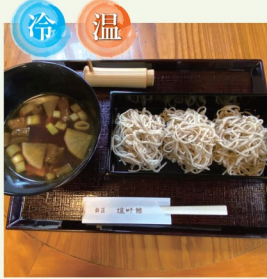
◇塩町館 ●古式けんちゃん 1,800円 (10食) 常陸太田市西一町 2325-1 Tel.0294-72-5911 定休/第4水・木曜