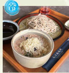
◇そば園佐竹/soba&coffee SATAKE ●冷やしくのみだれけんちゃん 1,100円 (15食) 常陸太田市 天神林町 5-207 Tel.0294-73-2288 定休/日曜・祝日