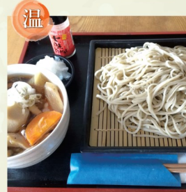
◇竜神庵 太田店 ●つけけんちゃん 900円 常陸太田市宮本町 464-2 Tel.0294-73-2888 定休/金曜