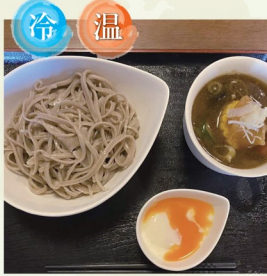
◇手打ちそば 赤土 ●夏野菜いっぱいけんちゃん 温泉卵付 1,300円 (10食) 常陸太田市 金井町 1788-2 Tel.0294-72-2008 定休/水曜