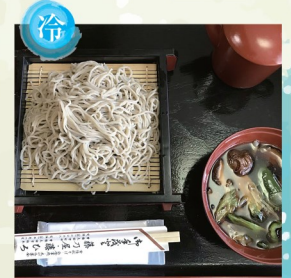
◇藤ひろ ●つけ夏けんちゃんそば 1,100円 (50食) 常陸太田市 松平町 210-1 Tel.0294-85-0913 定休/月曜 (祝日の場合は翌営業日)