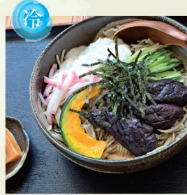
◇なか美 ●揚げなすとろろ蕎麦 1,000円 (10食) 常陸太田市 天神林町 870-151 Tel.0294-72-4645 定休/月・火曜