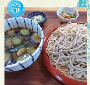
◇さかい (10食) ●夏野菜の冷や汁つけ 800円 常陸太田市花房町 2315-3 Tel.0294-76-1495 定休/木曜