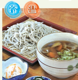
◇カネヒロ山桜直売所 ●夏けんちゃんつけそば 1,100円 (30食) 常陸太田市大中町 3652-1 Tel.0294-82-3178 定休/月・木曜